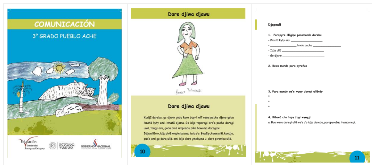
FIGURA 6 – Material de comunicação em língua aché para o 3º ano do ensino básico