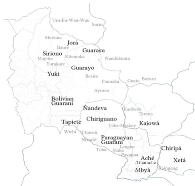
FIGURA 1 – Mapa de línguas do subgrupo Tupi-Guarani 1/2 (preto) e outras línguas indígenas (cinza) faladas no Paraguai e suas áreas de fronteira com o Brasil, Bolívia, Argentina.