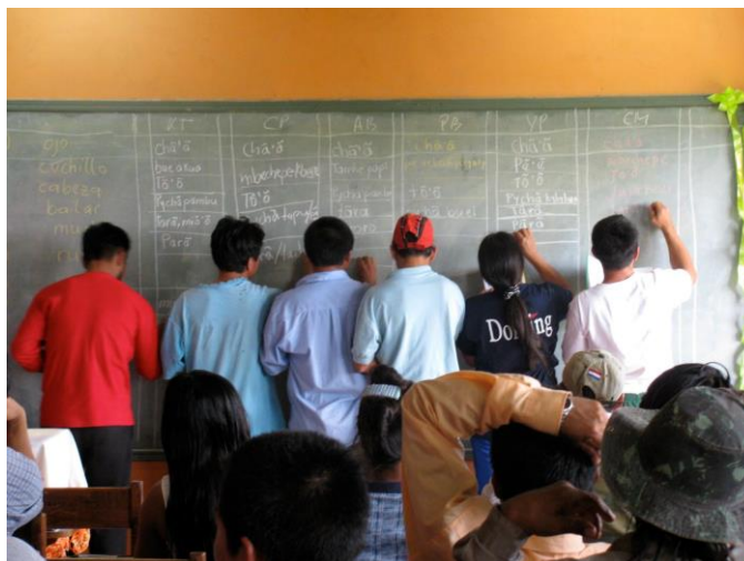
FIGURA 3 – Sessão de coleta de dados intercomunitários, para a ilustração de diferenças dialetais e para discutir inconsistências na escrita antiga, janeiro, 2009, Chupa Pou/Canindeyú.